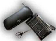
aparat de laminat, foarfecă și/sau ghilolină/trimmere